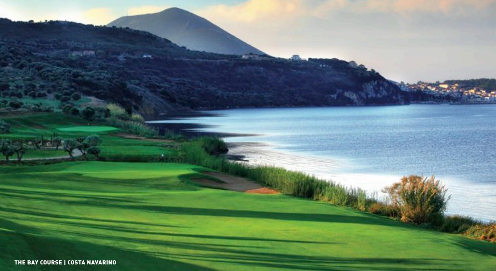
THE BAY COURSE | COSTA NAVARINO