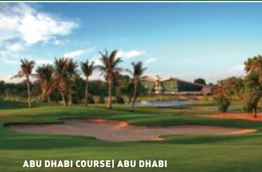
ABU DHABI COURSE | ABU DHABI