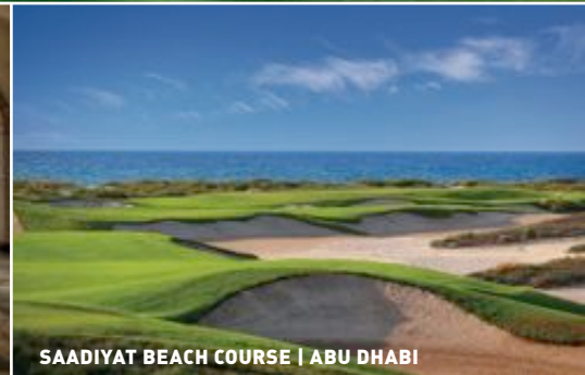
SAADIYAT BEACH COURSE | ABU DHABI