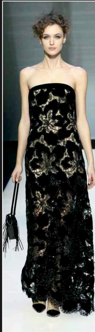
GIORGIO ARMANI Womenswear