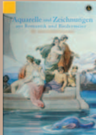
Aquarelle und Zeichnungen aus Romantik und Biedermeier

Sammlungskataloge des Herzog Anton Ulrich-Museums Braunschweig, Kunstmuseum des Landes Niedersachsen. Band XIII Hrsg. Jochen Luckhardt, Bearbeitet von Sabine Jacob und Susanne König-Lein. 248 Seiten mit 40 Farbtafeln und 130 Abbildungen in schwarzweiß. 21 x 29,7 cm. Leinen. ISBN: 3-7774-2285-1 Verlag Hirmer, München, 85 Euro