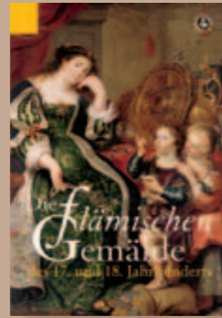
Flämische Gemälde des 17. und 18. Jahrhunderts

Die Sammlung „Andenken meiner Zeitgenossen“ des Bernhard Hausmann Sammlungskataloge des Herzog Anton Ulrich-Museums Braunschweig, Kunstmuseum des Landes Niedersachsen. Band XIV, Hrsg. Jochen Luckhardt, 320 Seiten mit 48 Farbtafeln und 230 schwarzweißen Abbildungen. 21 x 29,7 cm, Leinen ISBN: 3-7774-2505-2 Verlag Hirmer München, 80 Euro