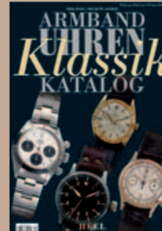
Armbanduhren Klassik Katalog

Sammlungskataloge des Herzog Anton Ulrich-Museums Braunschweig, Kunstmuseum des Landes Niedersachsen. Band XII, Hrsg. Jochen Luckhardt. Das Herzog Anton Ulrich-Museum zählt zu den ältesten Museen der Welt. Der vorliegende Band stellt die flämischen Werke einer der bedeutendsten Gemäldesammlungen Alter Meister in Deutschland erstmals wissenschaftlich kommentiert und in zahlreichen Abbildungen vor. Bearbeitet von Rüdiger Klessmann. 192 Seiten mit 40 Farbtafeln und 159 Abbildungen in schwarz-weiß, 50 Signaturen. 21 x 29,7 cm. Leinen ISBN: 3-7774-9930-7 Verlag Hirmer, München, 78 Euro