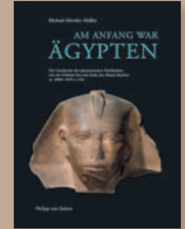
Am Anfang war Ägypten

Von Michael Höveler-Müller. Neue Erkenntnisse zur Geschichte der großen pharaonischen Hochkultur von der Frühzeit bis zum Ende des Neuen Reiches ca. 4000-1070 v. Chr., 303 Seiten mit 95 Farb- und 36 s/w Bilder; Format 17,5 x 25 cm; geb. ISBN: 3-8053-3444-3, Verlag Philipp von Zabern 39,90 Euro