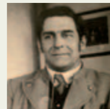
Foto: Franz Marc, ein Münchner: geboren am 8.2.1880. Mitbegründer der Gruppe „Blauer Reiter“ (s.a. Ausstellung, Murnau)

Jetzt, 90 Jahre später, knüpft die Städtische Galerie im Lenbachhaus an die zweite, etwas kleinere Retrospektive von 1980 an, und zeigt derzeit die größte und umfassendste Ausstellung über den Künstler. Die Ausstellung folgt grundsätzlich einer chronologischen Ordnung, innerhalb derer sich eine thematische Gliederung ergibt. Besonders reizvoll ist es, zu sehen, wie Franz Marc ein und dasselbe Thema in verschiedenen Techniken behandelt hat. Insbesondere durch die Bearbeitung des neuen Werkverzeichnisses haben sich zahlreiche neue Verbindungen der Werkgruppen untereinander, zwischen Skizzenbuchblättern, selbstständigen Papierarbeiten, Postkarten, Gemälden und nicht zuletzt Druckgraphiken und Hinterglasbildern ergeben. Da die Werkschau sämtliche Gattungen umfasst, entsteht ein dichtes Geflecht von Zusammenhängen und auch experimentellen Phasen im Werk von Franz Marc, das bislang in dieser Deutlichkeit nicht zu sehen war. Neben den Gemälden sind ca. 145 Arbeiten auf Papier, Skulpturen und Kunstgewerbe versammelt; die Ausstellung ist somit die umfangreichste seit der großen Franz Marc-Gedächtnis-Ausstellung von 1916 sein.