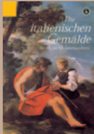
Italienische Gemälde des 16. bis 18. Jahrhunderts

Sammlungskataloge des Herzog Anton Ulrich-Museums Braunschweig, Kunstmuseum des Landes Niedersachsen. Band XIII Hrsg. Jochen Luckhardt, Bearbeitet von Sabine Jacob und Susanne König-Lein. 248 Seiten mit 40 Farbtafeln und 130 Abbildungen in schwarzweiß. 21 x 29,7 cm. Leinen. ISBN: 3-7774-2285-1 Verlag Hirmer, München, 85 Euro