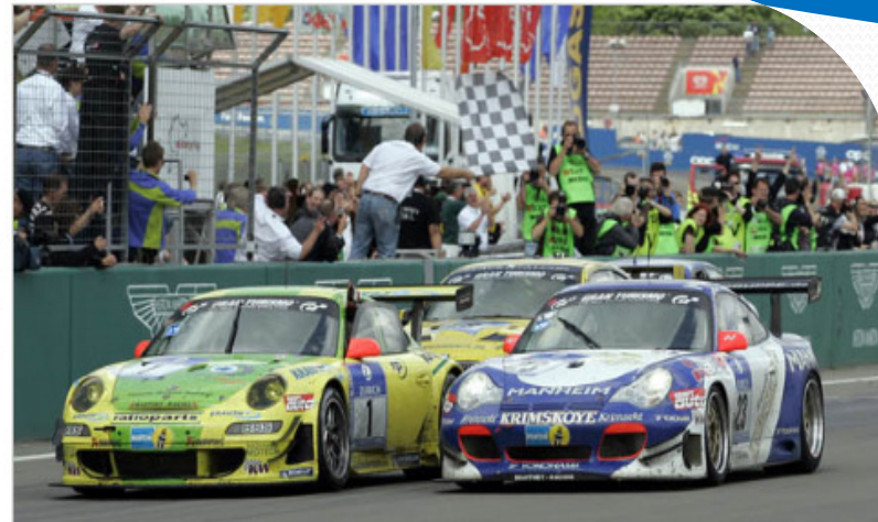
24h Nürburgring (2008)