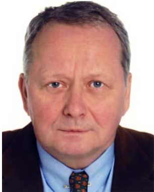
Dr. Wolfgang Porsche

Liebe Mitglieder des Porsche Club Deutschland, liebe Porsche Freunde,