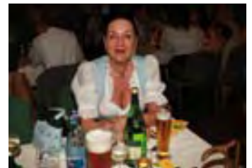
»So jung kommen wir ja auch nicht mehr zusammen.«