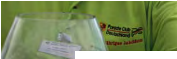
Munteres „Get-Together“ im PZ Reutlingen