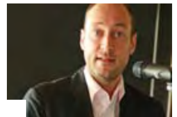
Perfekte Organisation in Weissach: Sonntagsbrunch mit Dixie-Musik zur Preisverleihung.