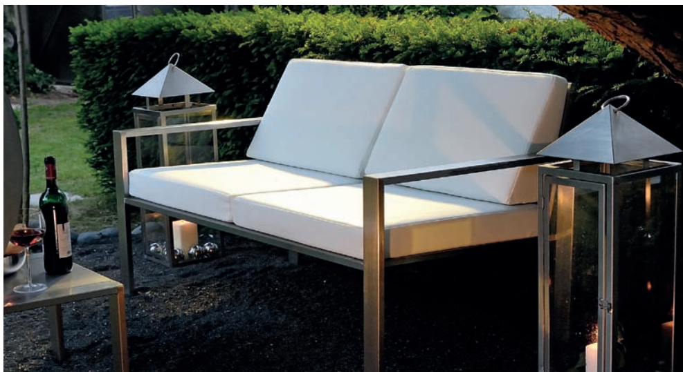
Lounge-Bank · Maße: 138 x 65 x 75 und 42 cm Sitzhöhe. Preis: 1.140 Euro inkl. MwSt. und Polster

Die Lounge-Bank (Modell GM 215) und der Wellness Lounge-Sessel (GM 212) aus Edelstahl sind Grenzgänger zwischen drinnen und draußen, somit für den Essbereich ebenso wie für den Garten oder Balkon geeignet. Das sechs Zentimeter breite Rahmengestell der Bank umgrenzt rundherum die filigranen Rücken- und Sitzverstrebrungen. So wirkt sie robust, was zusätzlich durch die breiten Armlehnen unterstrichen wird, und ist dennoch äußerst elegant. Durch die ergonomisch optimale Sitzhöhe ist auch das Aufstehen völlig problemlos. Egal, wo man sie platziert, ihre Bequemlichkeit empfindet man schon, wenn man in den dicken Polstern Platz genommen hat. Dasselbe gilt natürlich auch für den Lounge-Sessel. www.lizzy-heinen.de